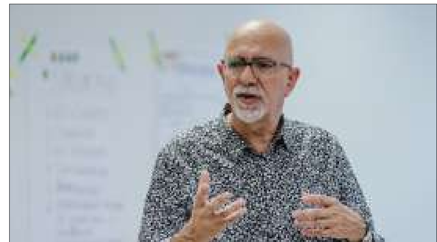
¿Qué es la Inteligencia Conversacional?