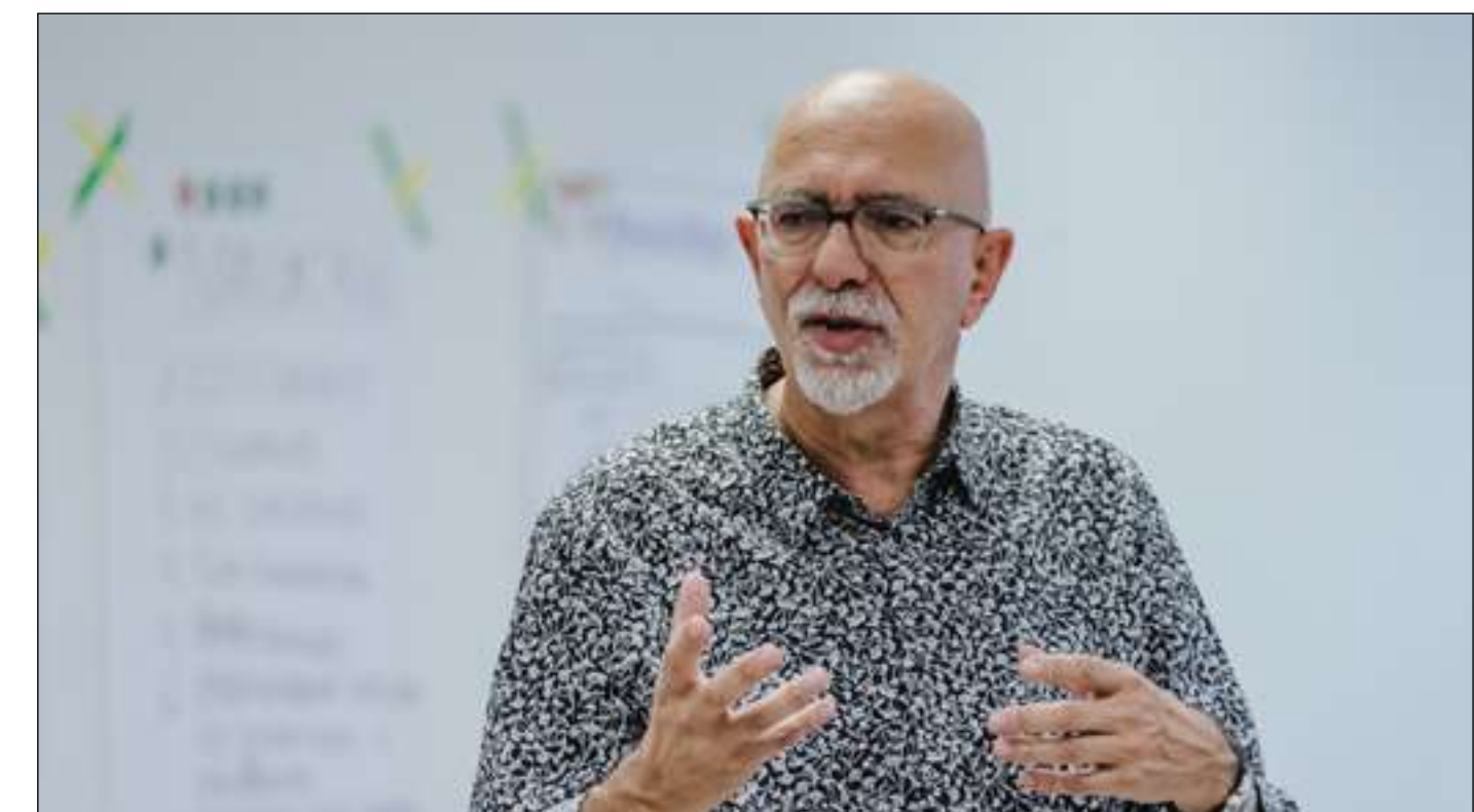
¿Qué es la Inteligencia Conversacional?