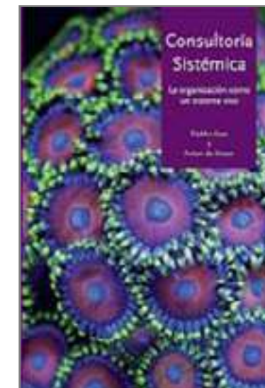
Consultoría sistémica. La organización como sistema vivo