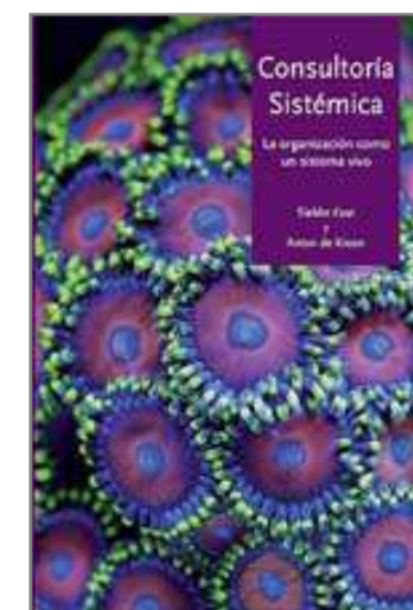
Consultoría sistémica. La organización como sistema vivo